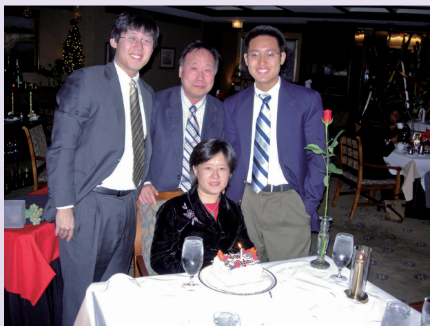
▼楊學長夫人慶生全家福照

往於美國公司及海外生產基地，相信以他完整的教育基礎，將為此傳統產業盡一份產業提升之力，並帶來他個人在其他視野創新的願景。