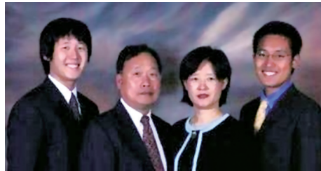
▲2005年郵輪上拍攝全家福