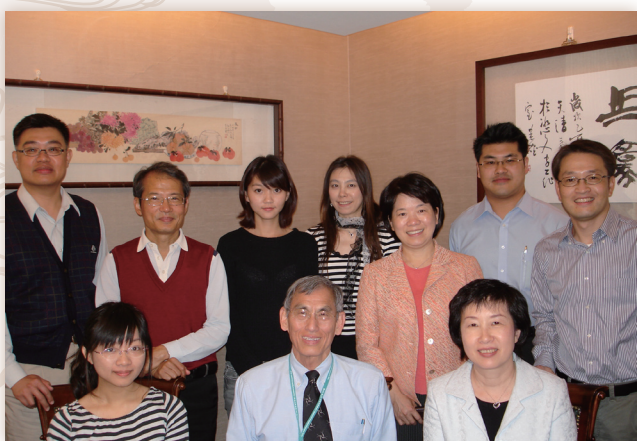
2009年3月30日林校友與應用經濟系教師聚餐