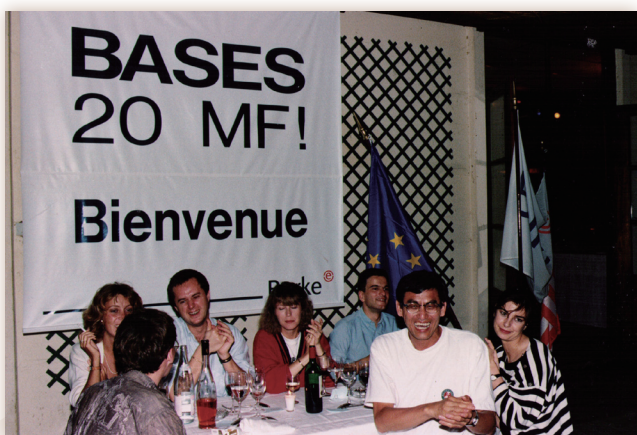
1988年與法國、英國和美國的同事於巴黎塞納河中之一小島慶祝 法國辦公室BASES業務金額超過2千萬美元