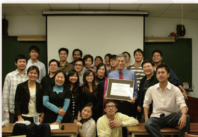
2009年3月31日林校友與學生合影